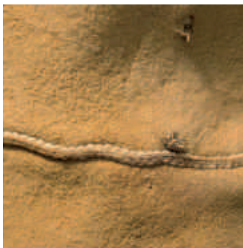
Afb. 4 Detail van de kolder van Hendrik Casimir (afb. 3): resten van lussen.