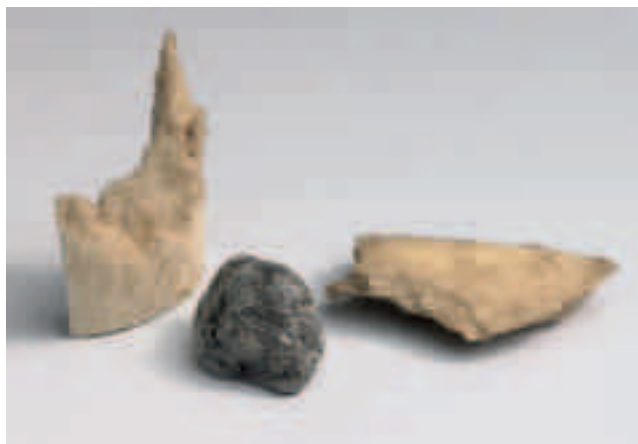
Afb. 1 Fragmenten van een kogel en van stukjes bot van Hendrik Casimir, 1640. *Rijksmuseum, Amsterdam (inv.nrs. NG-NM-1110b, -1111).