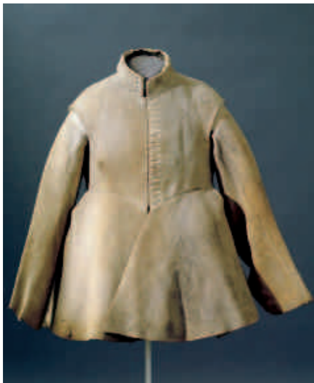
Afb. 7 Kolder die de Zweedse vorst Gustaaf Adolph droeg toen hij sneuvelde bij Lützen in 1632. Livrustkammaren (The Royal Armoury), Stockholm.

van mouwen. Kolders met mouwen uit de periode omstreeks 1640 of eerder zijn trouwens schaars. De kolder die de Zweedse vorst Gustaaf Adolf droeg toen hij sneuvelde bij Lützen dateert van 1632 of eerder (afb. 7). Een uitbundig met passementen versierd exemplaar bevindt zich in het Bayerische Nationalmuseum. De mouwen van deze kolder hebben aan de voorzijde een split waardoor ze afhangen op een wijze die bekend is van de zogenaamde ruitermantel of kazak. 16 Ten slotte is er een kolder met mouwen die omstreeks 1625 wordt gedateerd en mogelijk is vervaardigd voor de Engelse kolonel Alexander Popham (afb. 8).