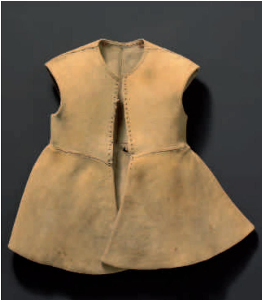
Afb. 3 Kolder van Hendrik Casimir, 1630-1640. Leer, h. 62 cm. Rijks- museum, Amsterdam (inv.nr. NG-NM-1100).