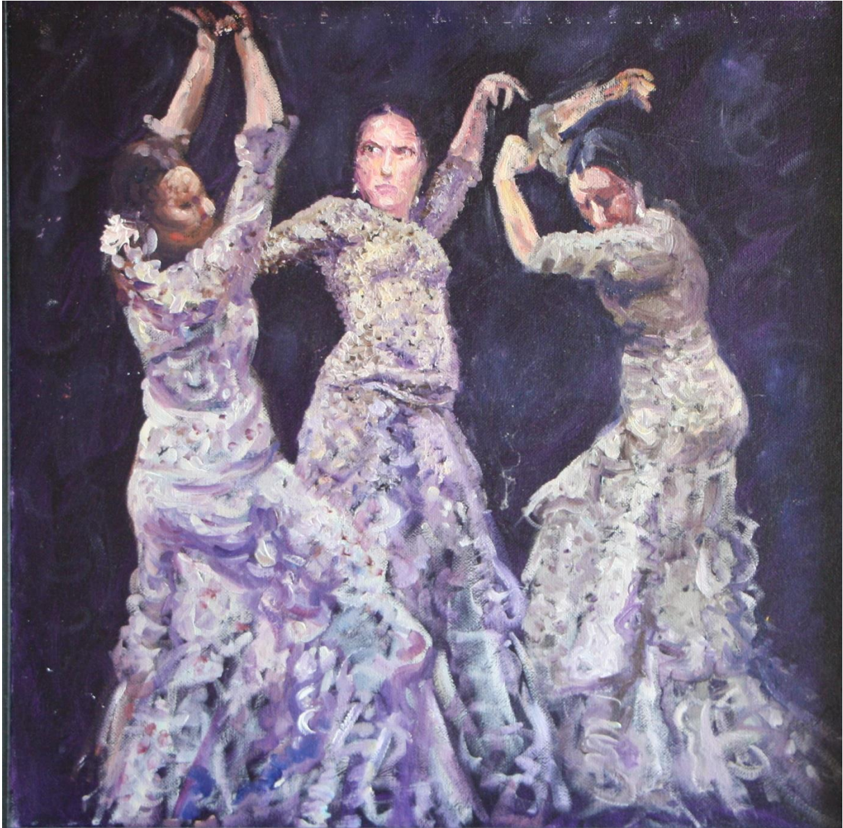
Drie flamingo danseressen, 2020, 40 x 40 cm