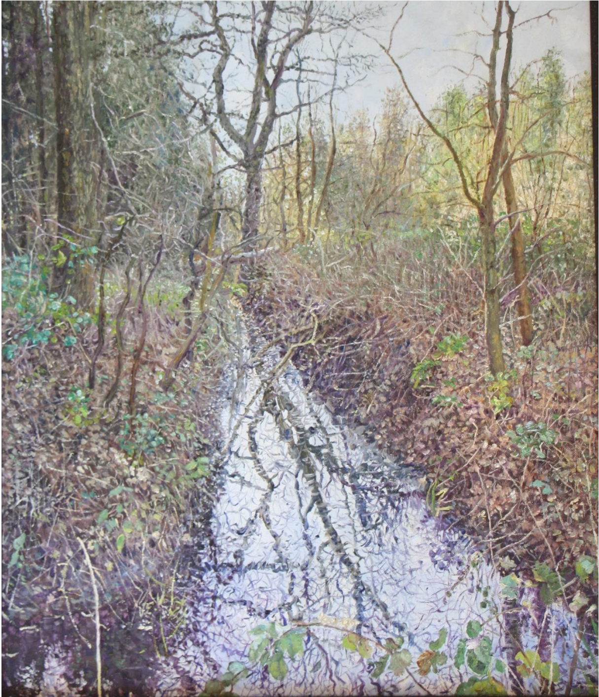
Bomen en struiken bij sloot, 2021, 52 x 62 cm