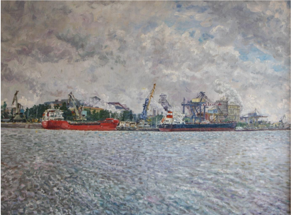
Industriegebied Terneuzen, 2004, 76 x 57 cm op paneel