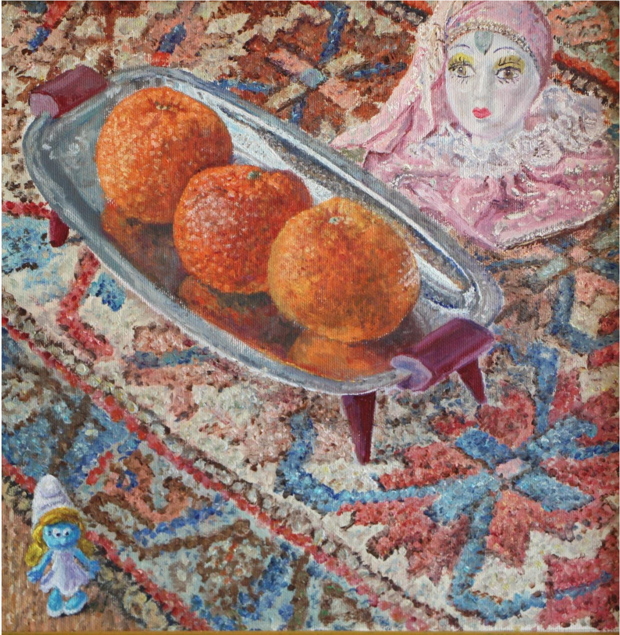
Drie mandarijnen, 30 x 30 cm