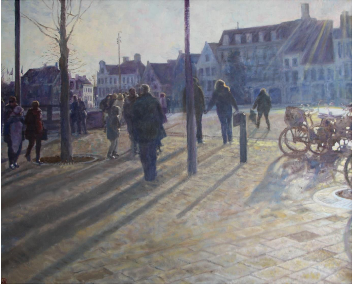
Brugge, 2019, 100 x 80 cm