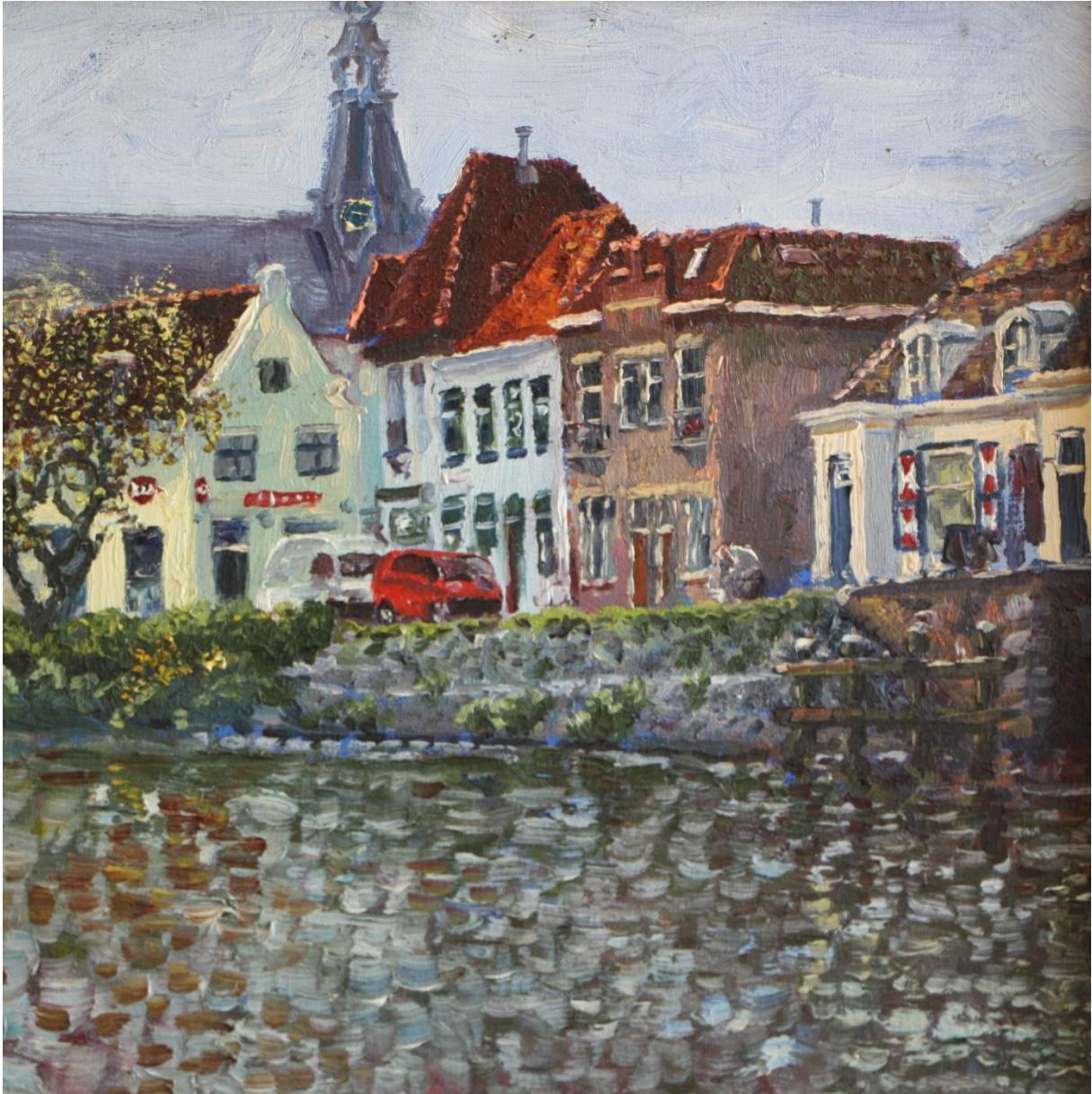
Muiden ?, 30 x 30 cm