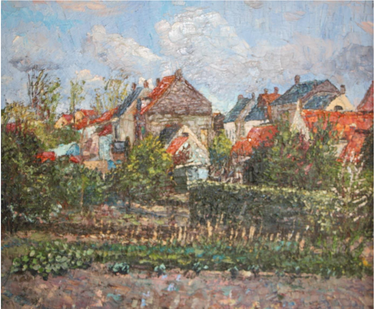
Tuinen bij Paal, 2000, 60 x 50 cm op paneel