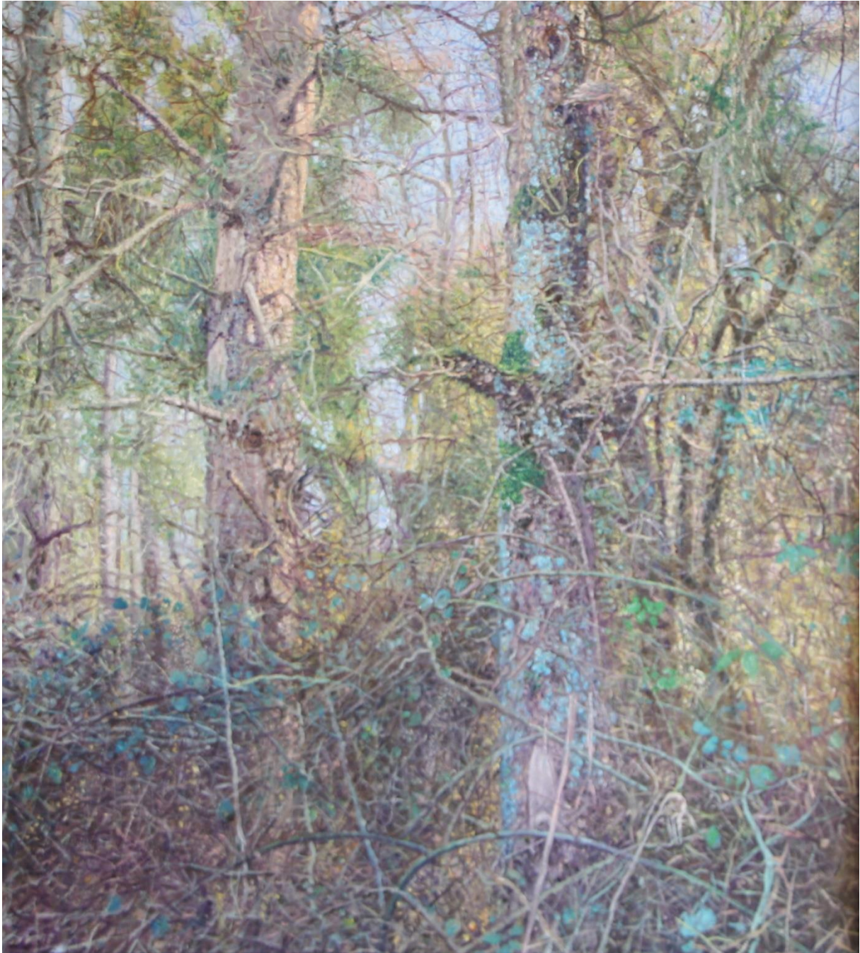
Bos, 2012, 60 x 67 cm