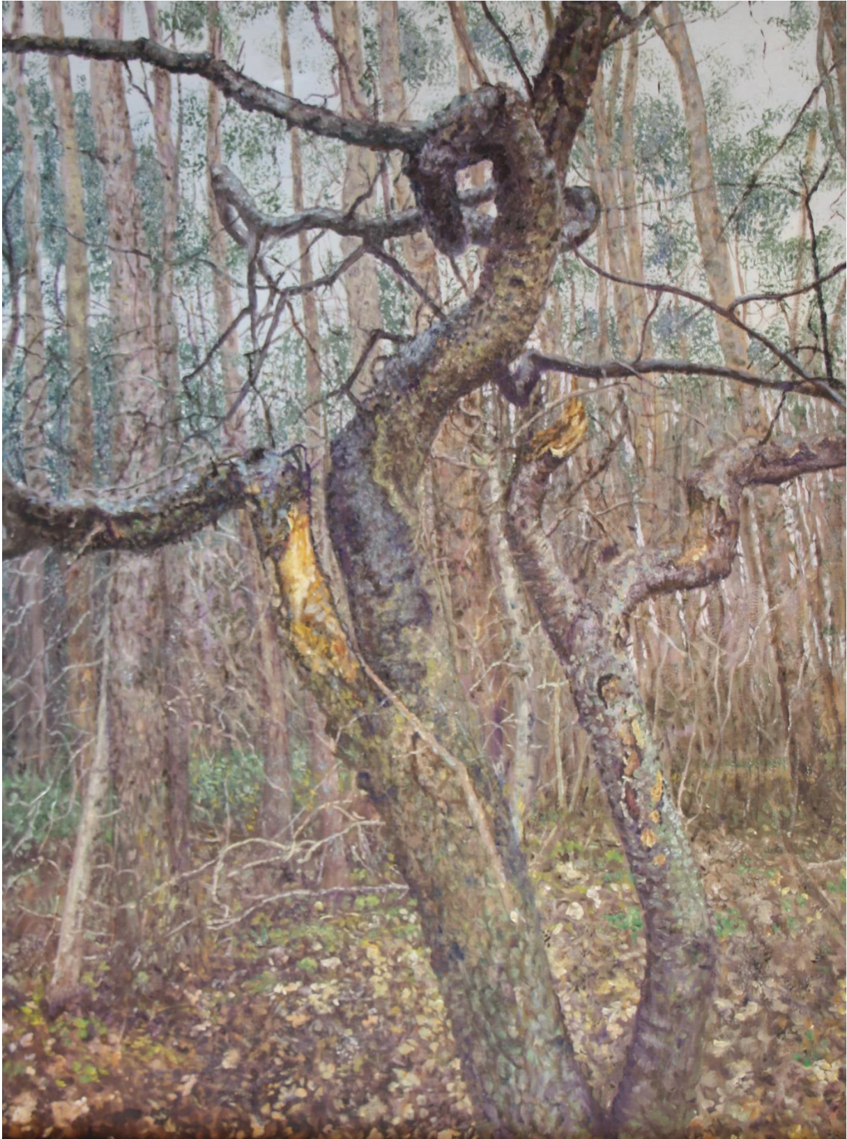
Boom met breuk, 40 x 80 cm