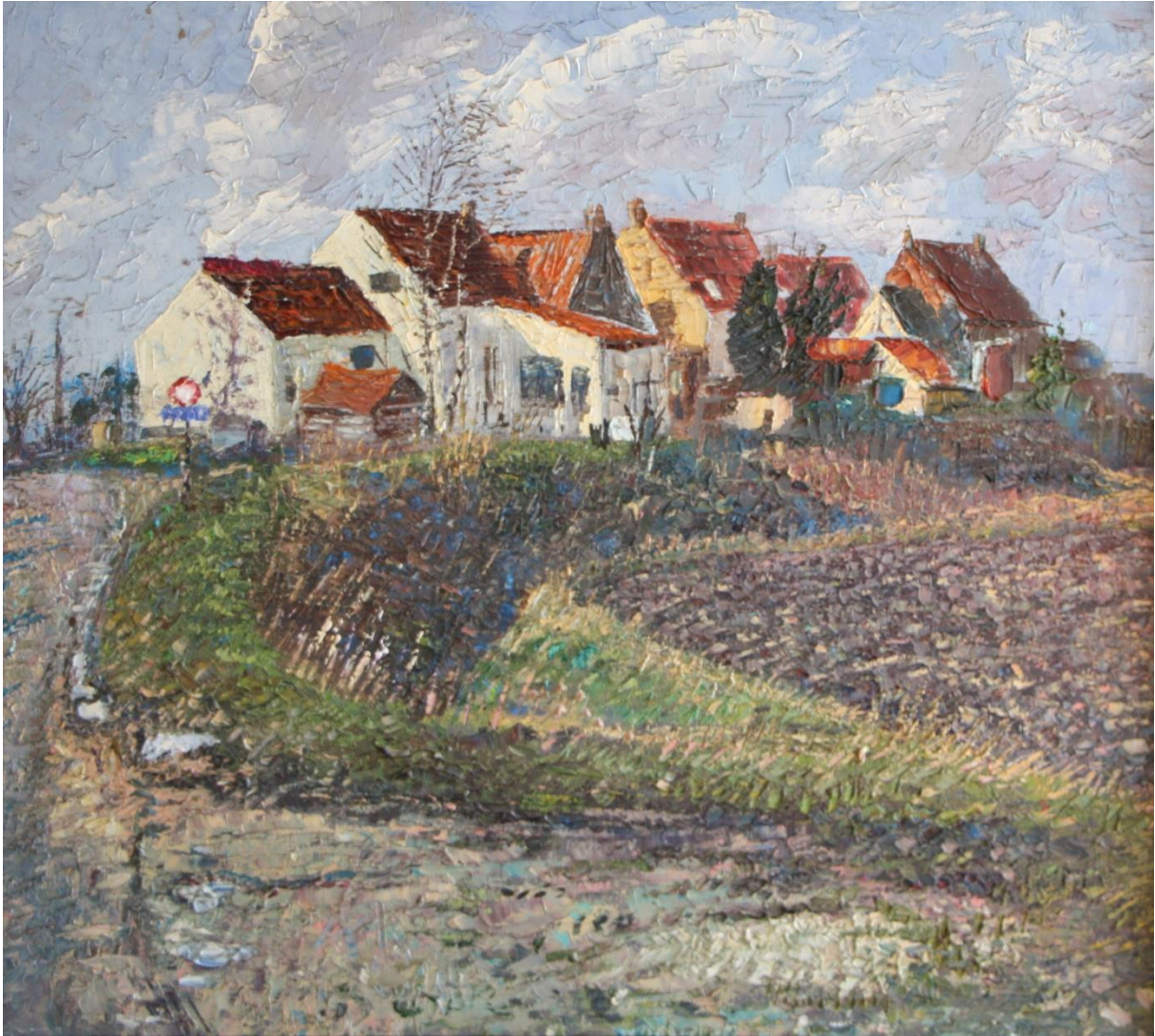
Dorpsgezicht, 2000, 55 x 50 cm