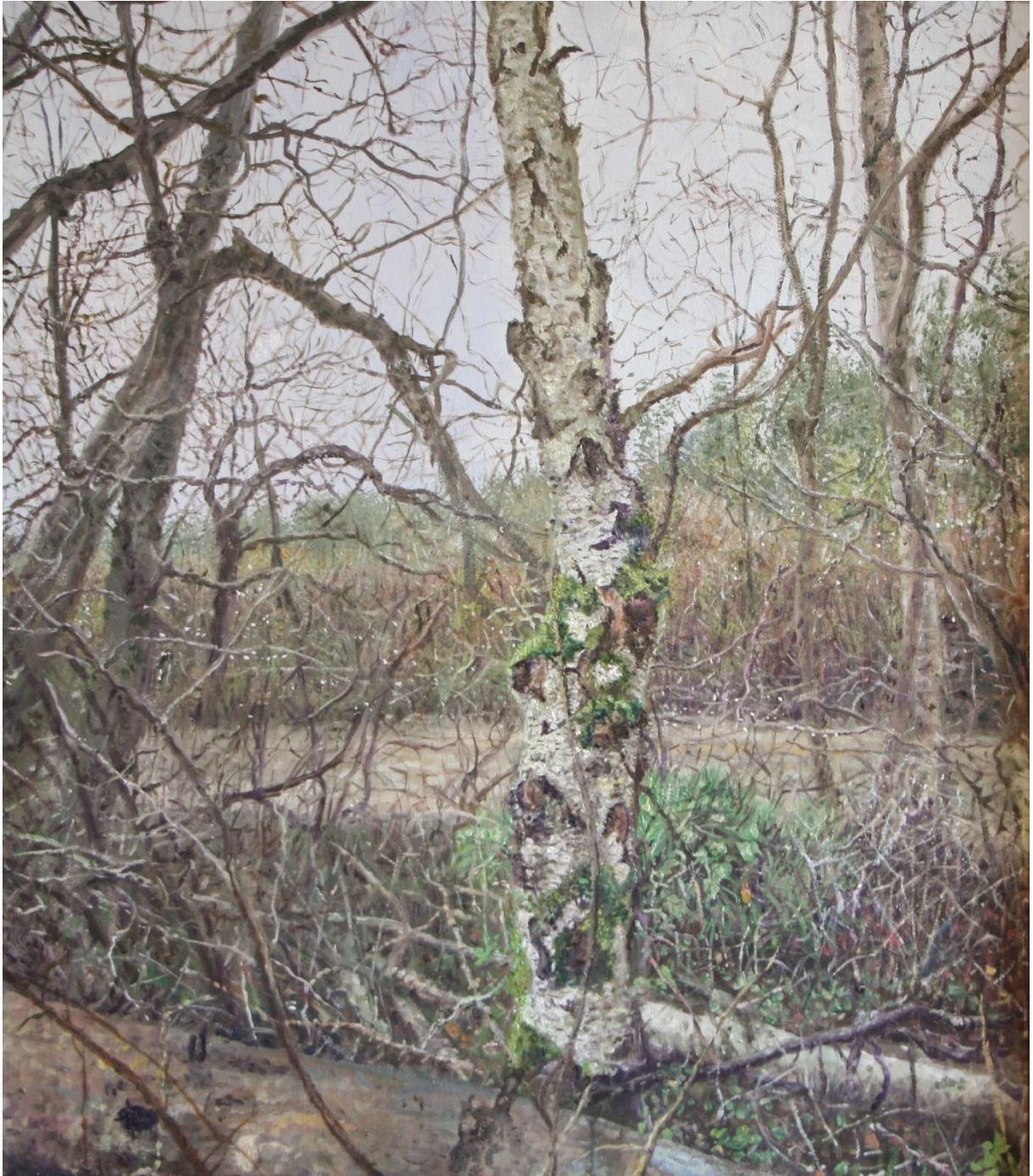
Berkenboom, 52 x 62 cm