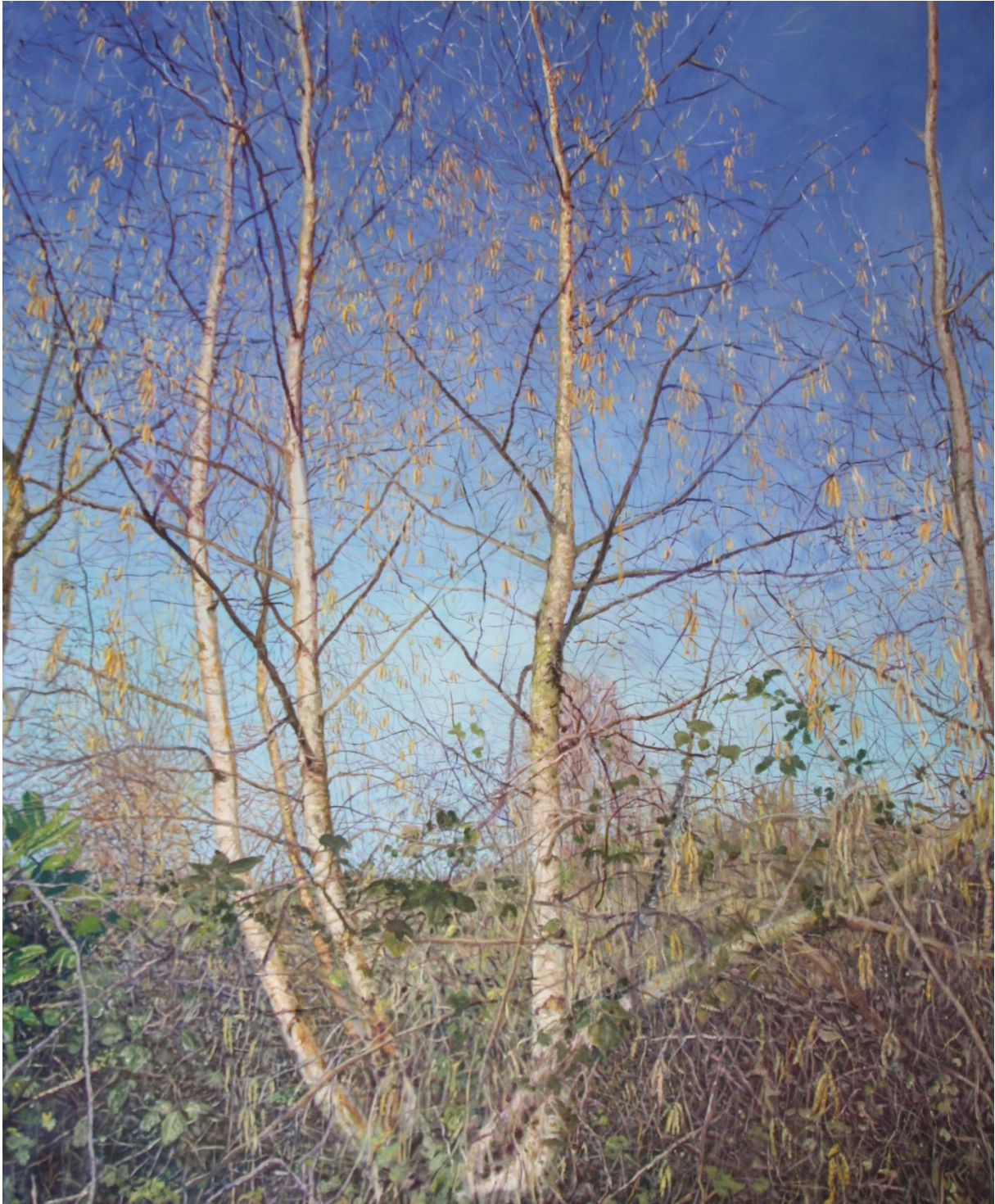
Boom met katjes, 2024, 88 x 107 cm