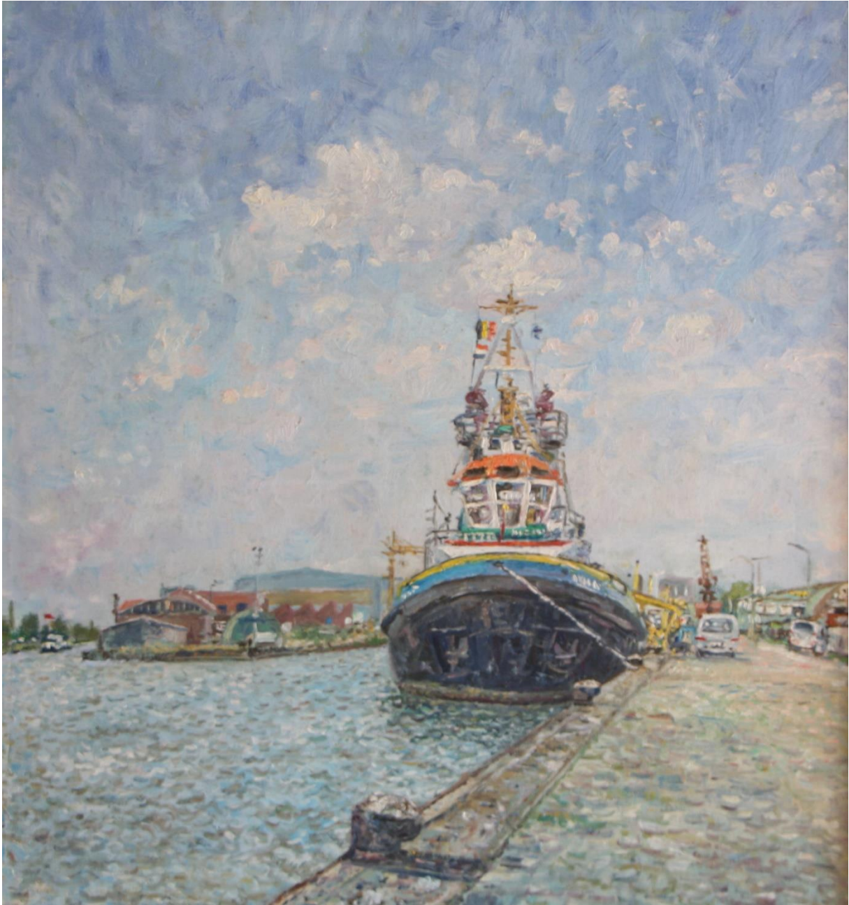
Sleper voor de wal Terneuzen, 2004, 54 x 58 cm