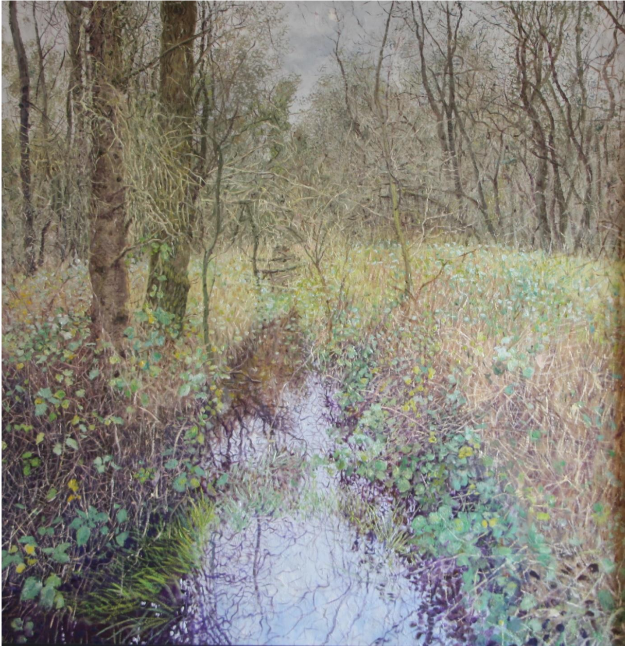
Bomen bij kreek, 2012, 68 x 70 cm