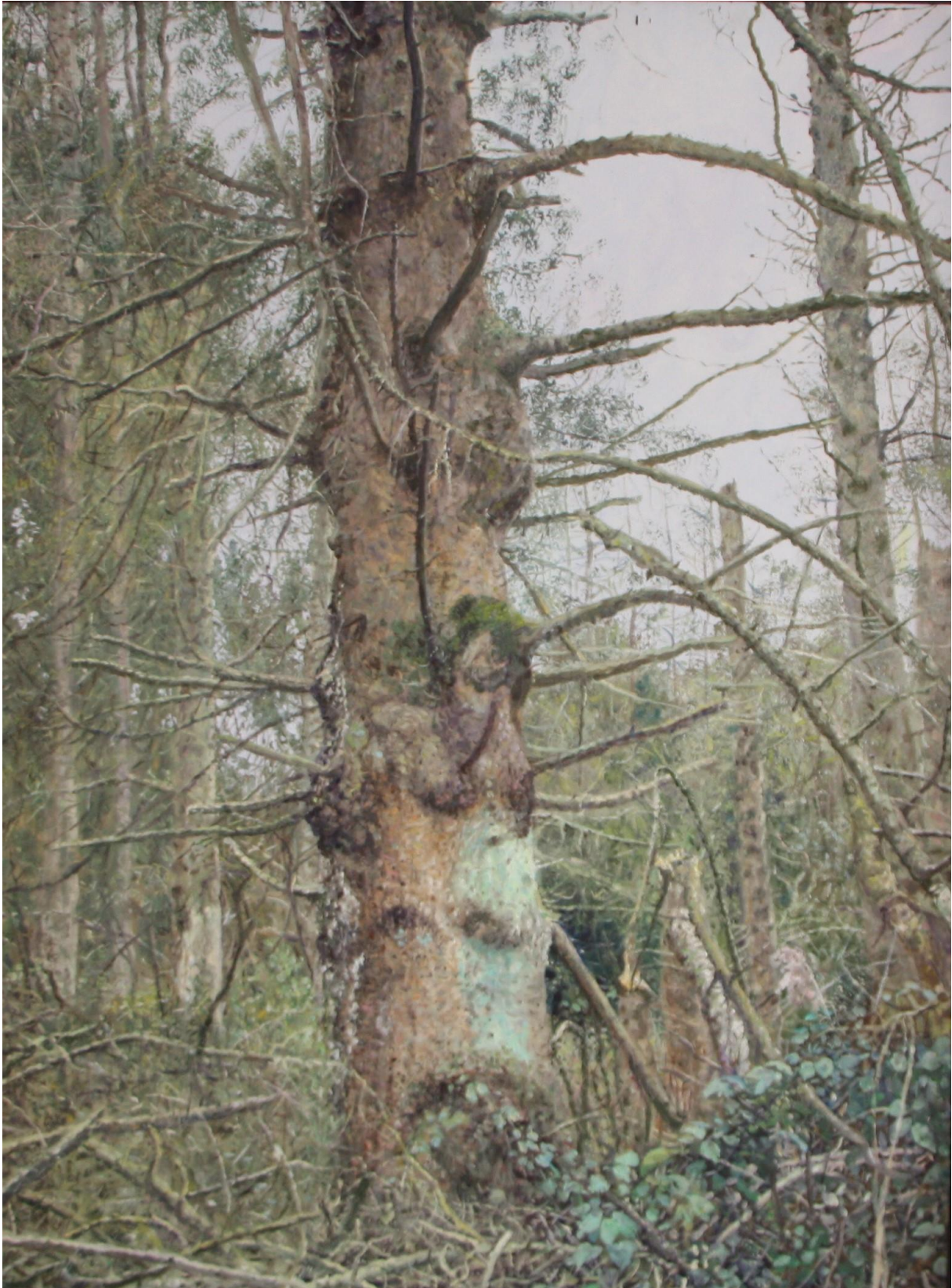
Boomstam met klimop, 60 x 80 cm