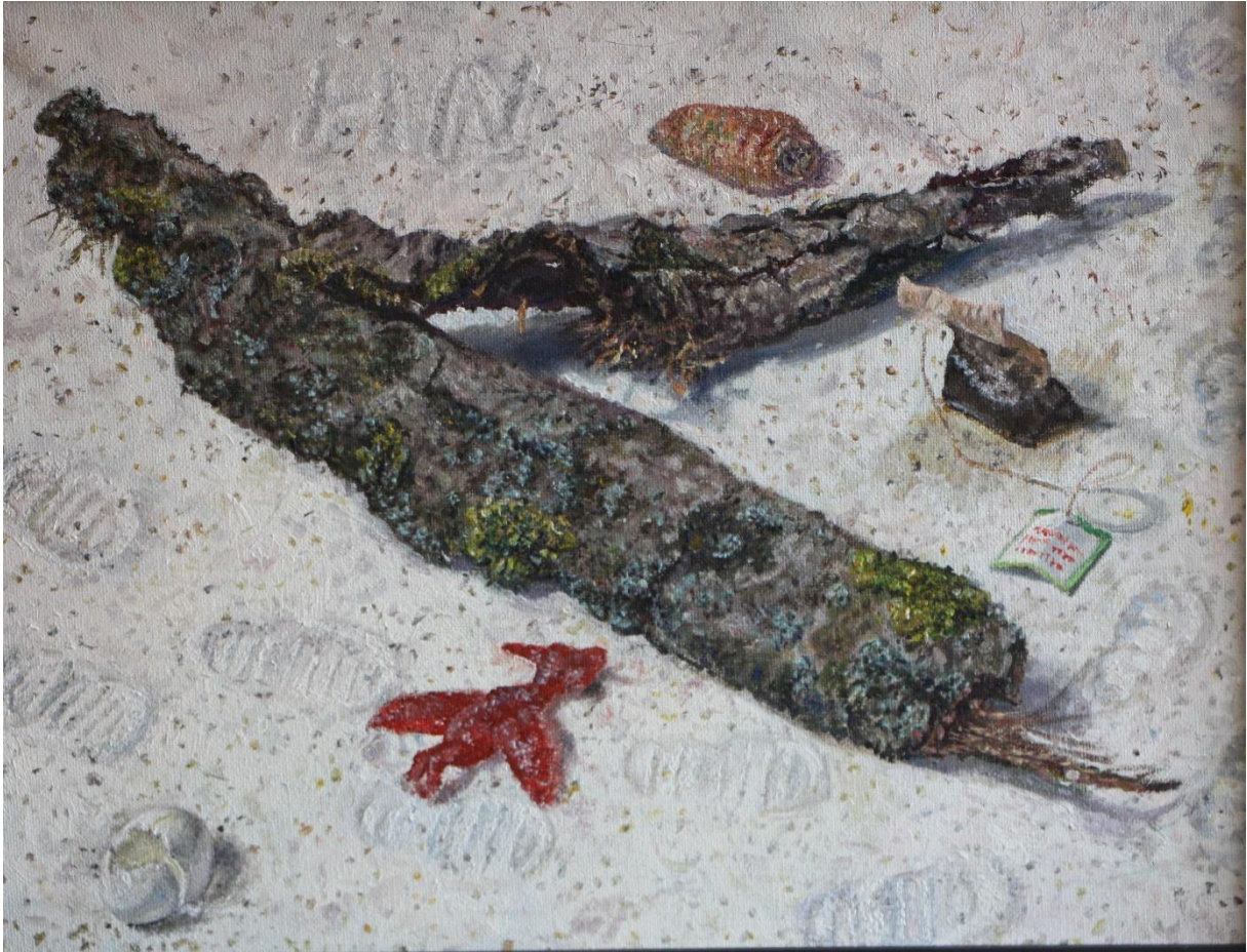
Strandgoed en voetstappen, 40 x 30 cm