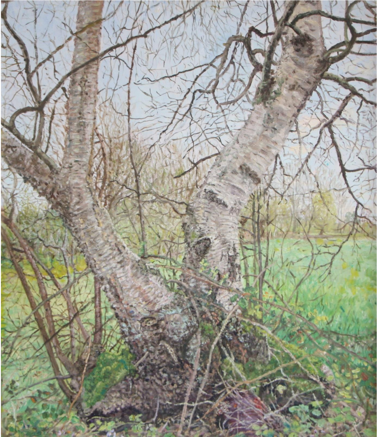
Berkenboom met twee stammen, 52 x 62 cm