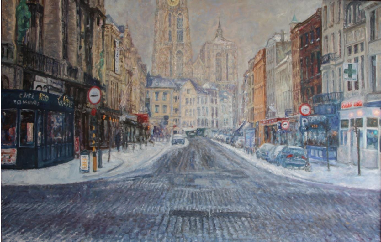
Antwerpen, 1995, 117 x 75 cm