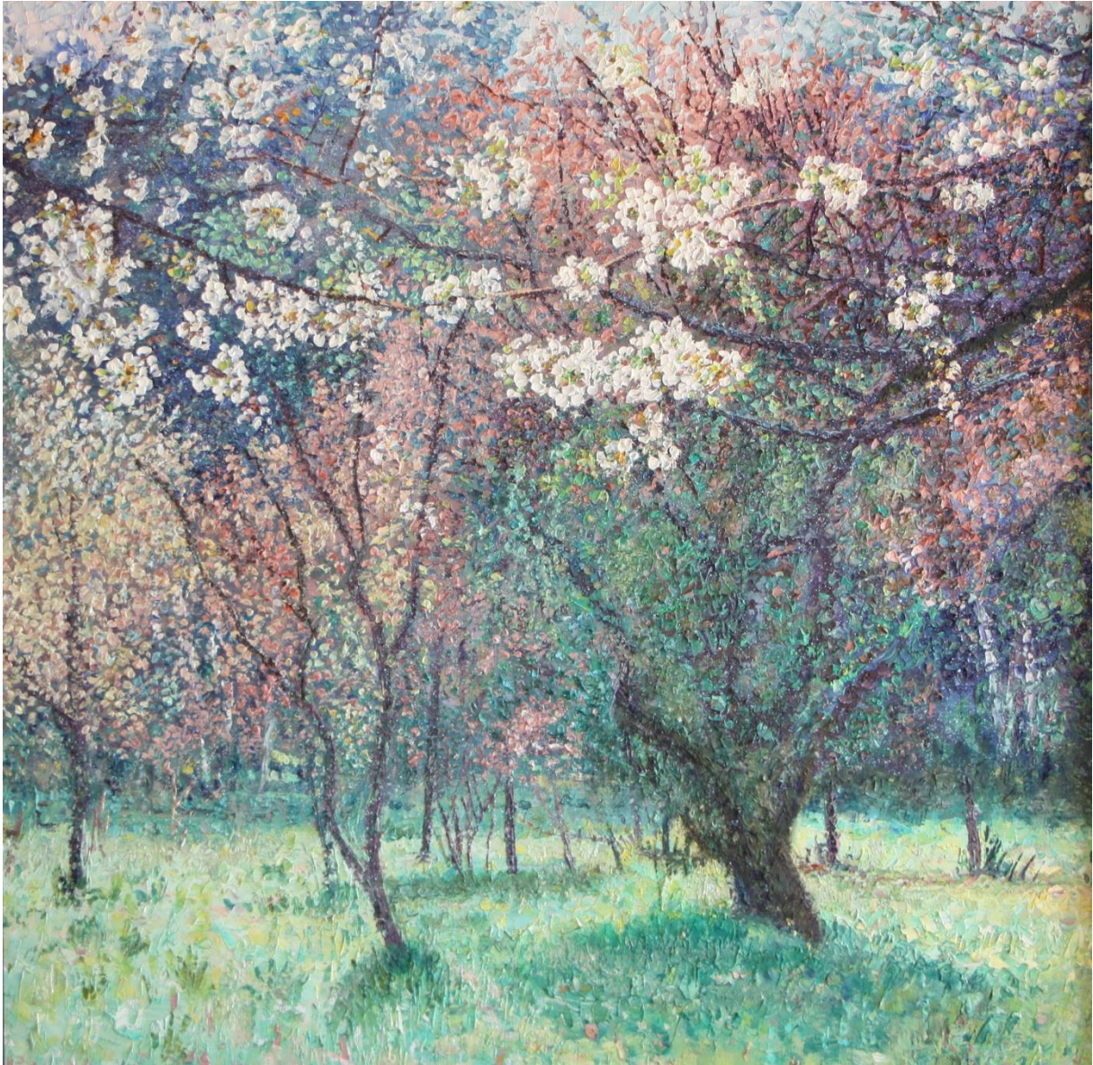
Bomen in bloei, 60 x 60 cm