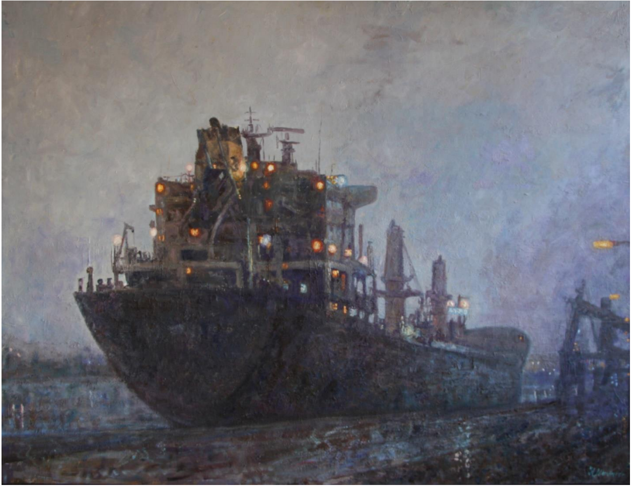
Schip aangemeerd, 130 x 100 cm