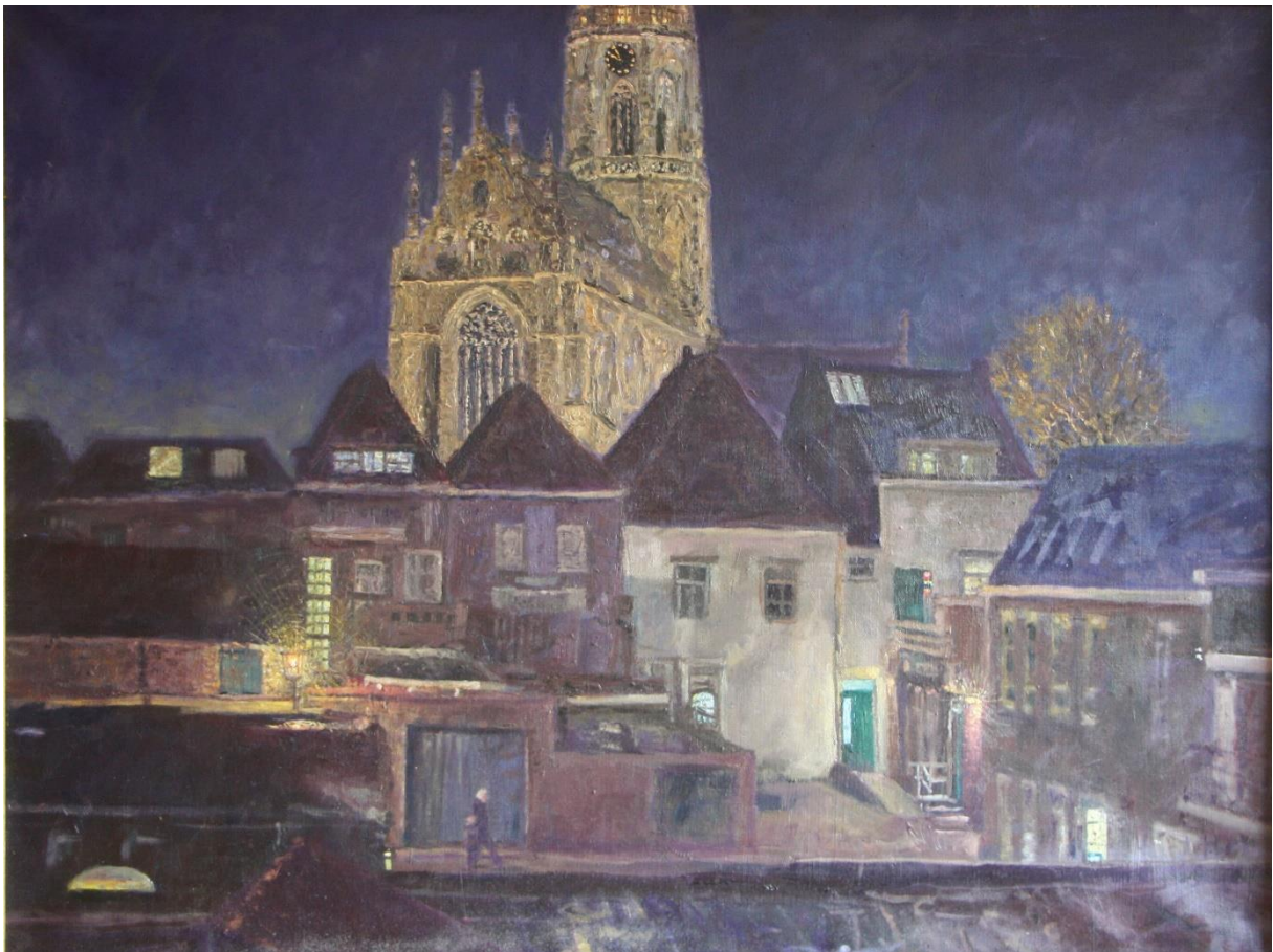
De Basiliek Hulst, 2017, 80 x 60 cm