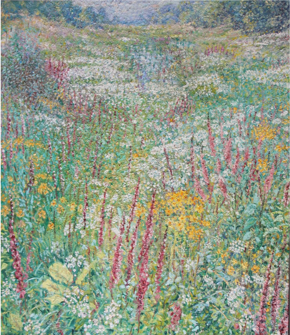
Veld met bloemen, 2003, 70 x 80 cm