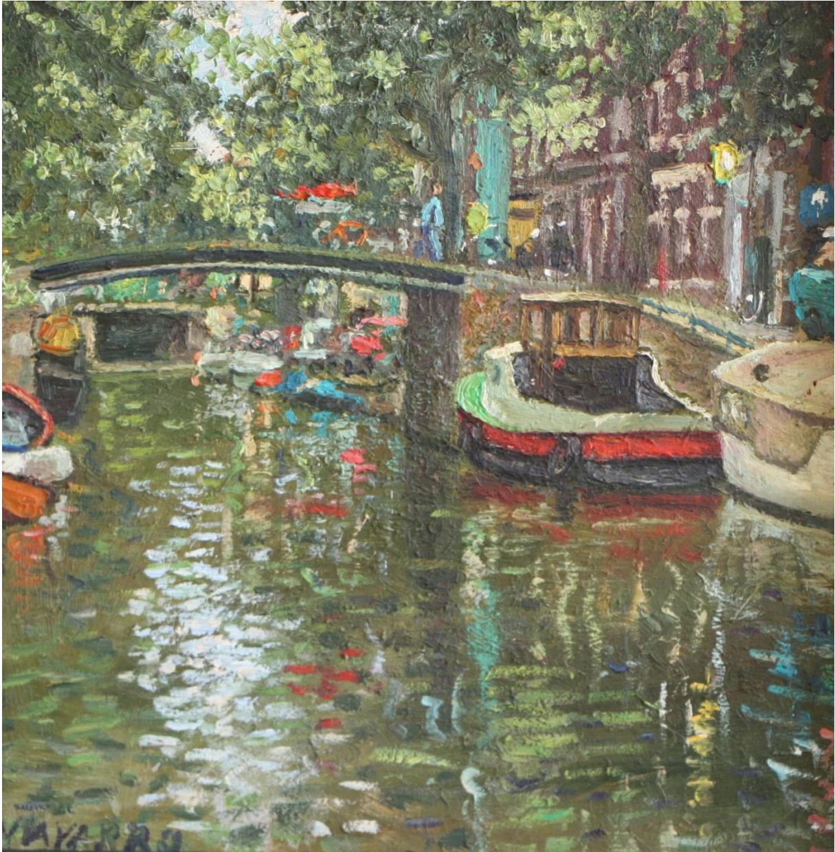
Amsterdam, 30 x 30 cm