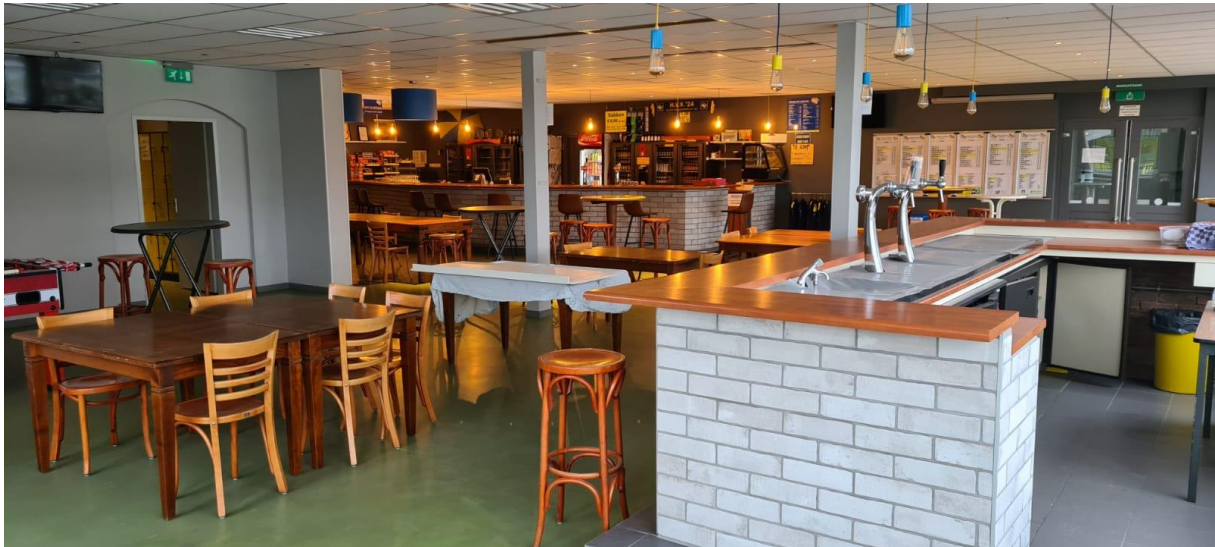
Kantine anno 2020