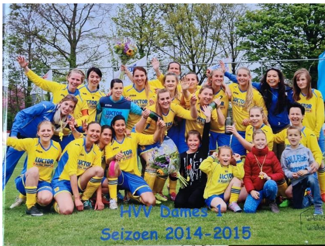
Het kampioensteam 2014-2015