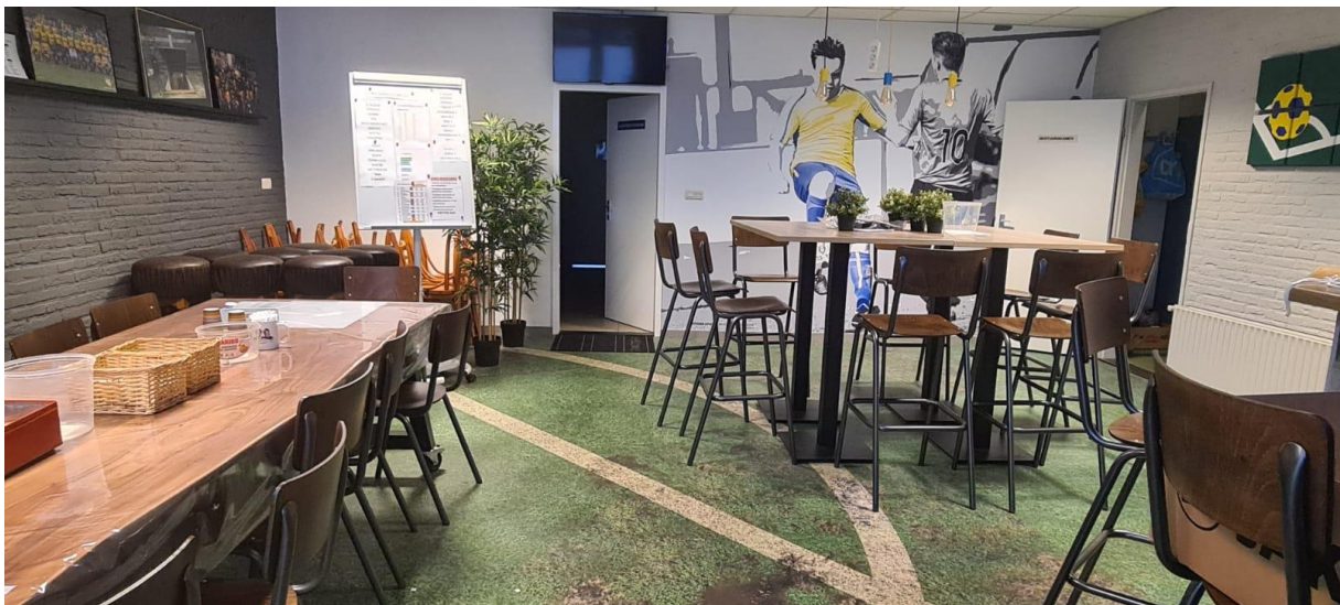
Bestuurskamer anno 2020