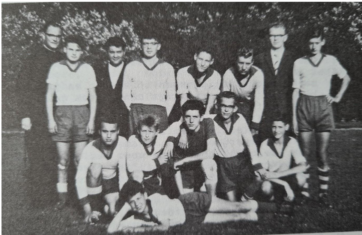
HVV'24 B1 kampioen 1959-1960