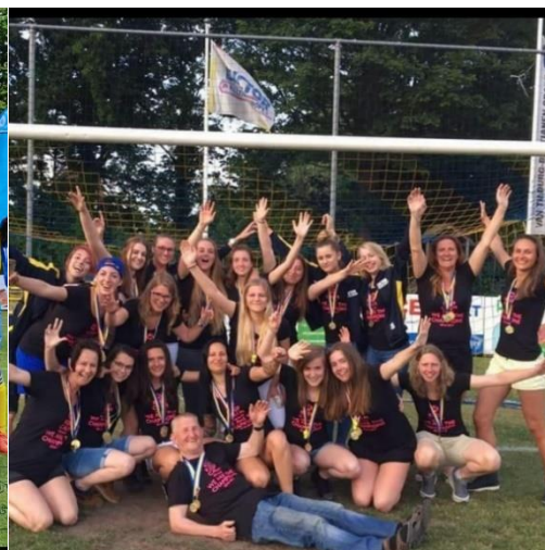
Het kampioensteam 2016-2017