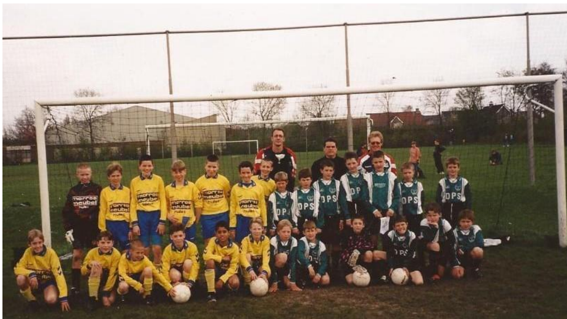
HVV D1 tegen de Longfield Tigers