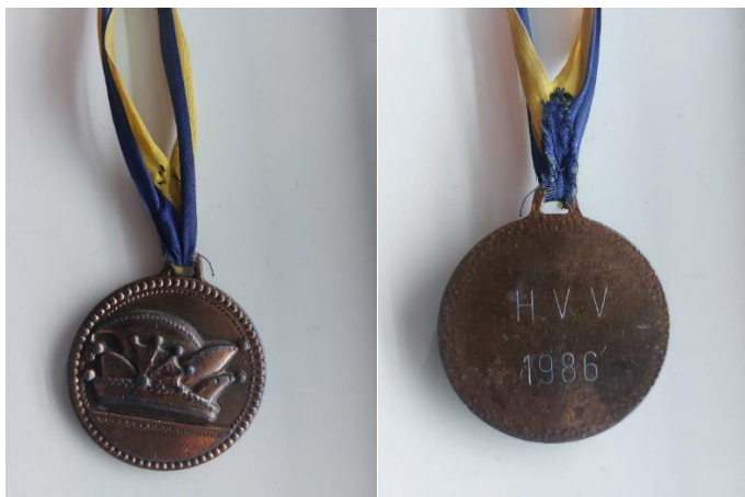
Huib Buijsse medaille carnaval