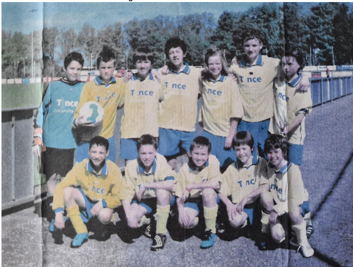
Foto van het winnende team: HVV'24 D1 2009-2010

Naast de promotie kwamen we ook ver in de beker. In de halve finale wonnen we verdiend met 4 – 1 van Kloetinge D1.